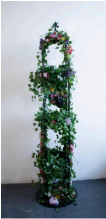
Trellis Mask (red, green, purple), 2024

Fused, cast and blown glass with artificial leaves on metal frame