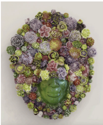
Bloom in Spring Green & Purple, 2023