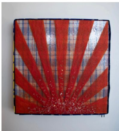
Ray [Glimmer of Hope], 2024

Fused glass and Ghana Must Go on custom panel