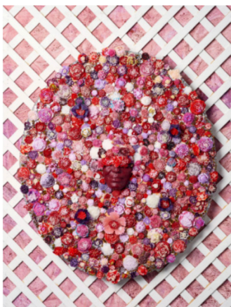
Bloom in hues of Red, Pink, Purple, 2024

Cast, blown, fused, mirrored glass and 23k gold leaf on custom frame 45 x 38 x 6 in