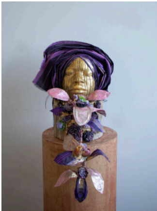
Aso Ebi: Regal in Purple & Gold, 2024

Gele, fused and cast glass flowers, repurposed wood, Ghana Must Go bag, gold pigment, 23k gold leaf, wire 23 x 12 x 15 in