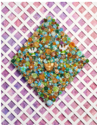
Bloom in hues of Blue, Green, Brown, 2024

Cast, blown, fused, mirrored glass and 23k gold leaf on custom frame 46 x 37 x 6 in