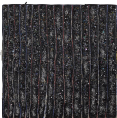
Marked [Greener Pastures] , 2022

Fused glass and Ghana Must Go on custom panel 20 x 20 x 2 in