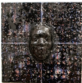
Point of Last Scatter , 2020

Kiln formed glass, Ghana Must Go bag on wood frame 20 x 20 x 3 in