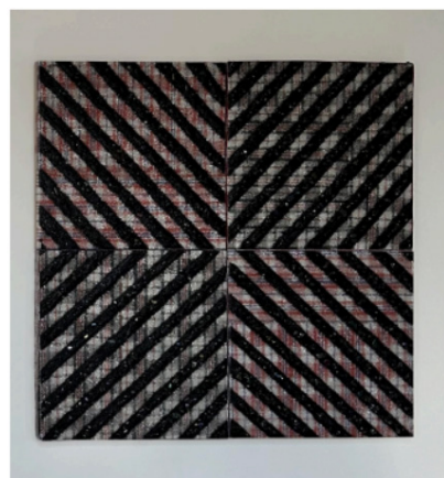
Marked [Nexus], 2024

Fused glass and Ghana Must Go bag on custom panel