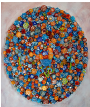
Bloom in hues of Orange, Blue, Red, 2024