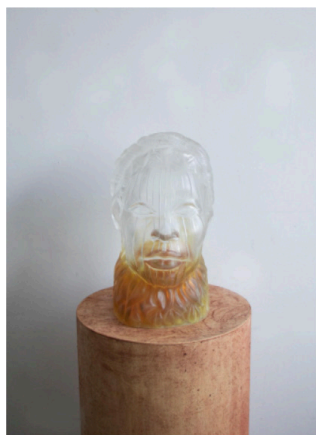
dawn [gold topaz] #3, 2021