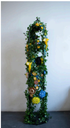
Trellis Mask (yellow, orange, blue), 2024

Fused, cast and blown glass with artificial leaves on metal frame