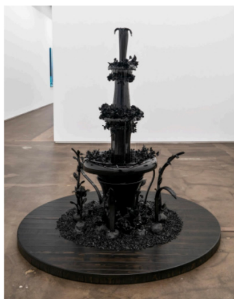
The Thorns and the Roses, 2022

Blown, fused, and crushed glass, pump, PVC pipe, water, and mixed media with custom wood pedestal