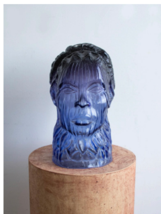
dusk [sari blue] #3, 2024