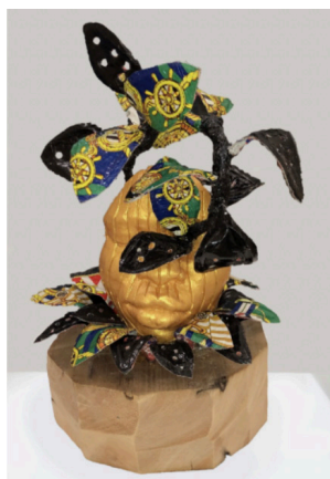
The Captain of My Own Ship, 2020

Gele, Ghana Must Go bag, plaster, gold pigment, wood 15½ x 10½ x 9 in